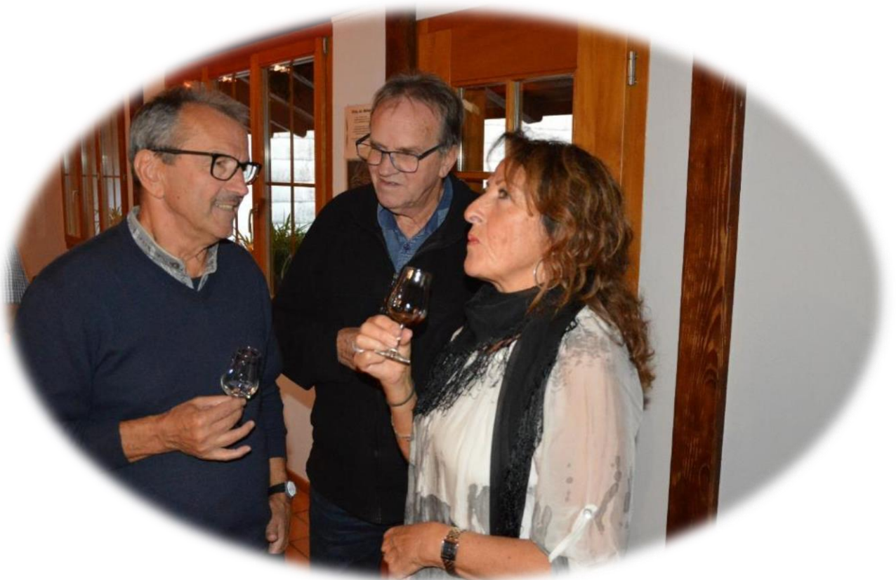
Die Degustation wurde rege genutzt

Bei der Einführung in die Geheimnisse der Brennerei durfte natürlich die Degustation nicht fehlen. Ob Ur-Dinkel Whisky, Single Malt, „anders Rum“ Chrüter oder Quitten Likör etc., es war für jede/n etwas dabei.